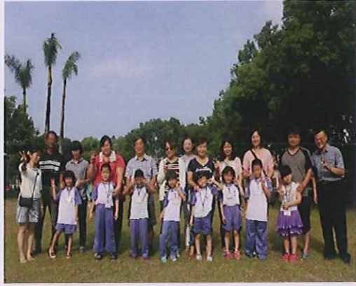
小一新生與校長、導師合照