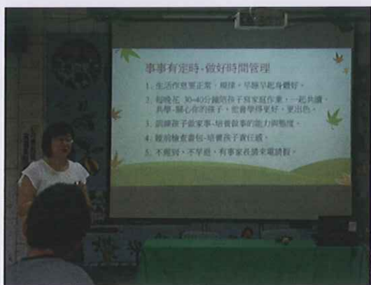
黃主任的叮嚀-事事有定時