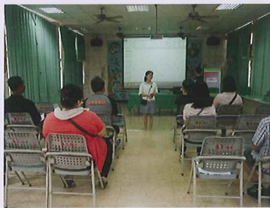
小一導師與家長相見歡