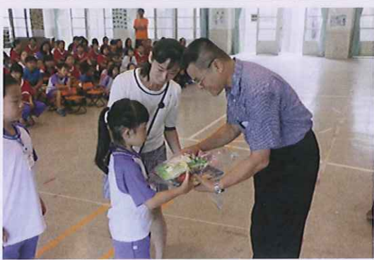
閱讀起步走贈書活動