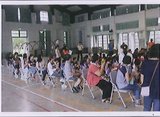
新生家長敬茶感恩禮