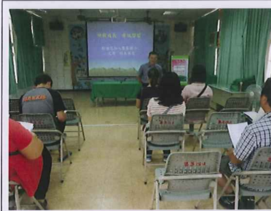
校長對新生家長的期許