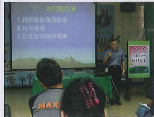
校長說明親師溝通的重要