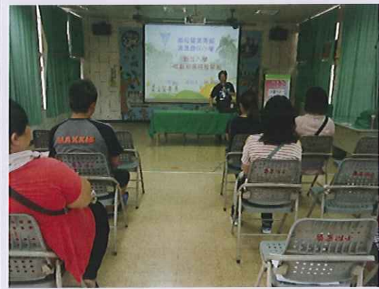
總務主任介紹學校設施