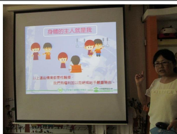
拒絕性騷擾、性侵害、性霸凌