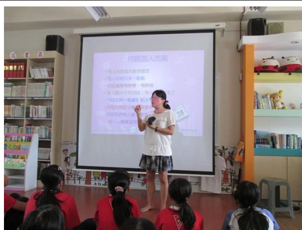
護理師指導衛生棉使用方式