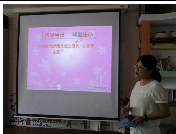
珍愛自己、尊重生命