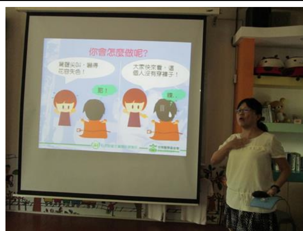
遇到性騷擾時處理方式