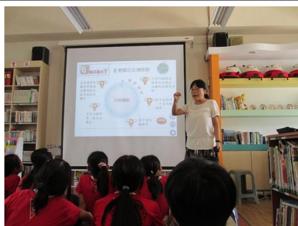
認識月經週期與處理方式