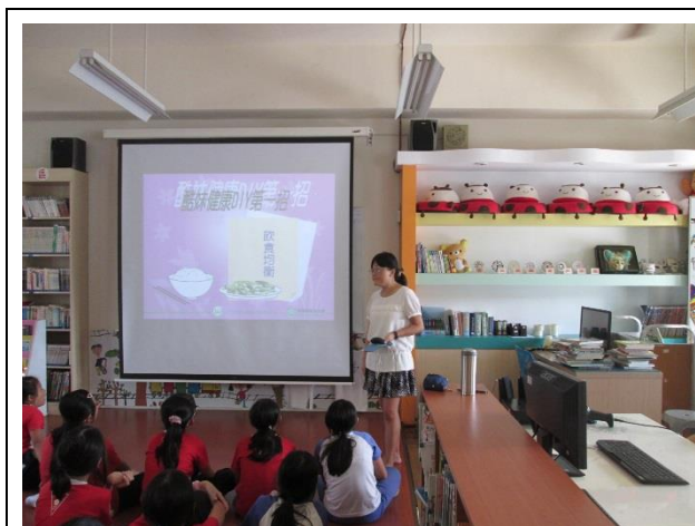
酷妹第一招-均衡飲食