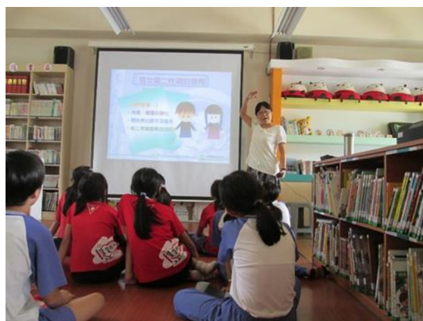
男女第二性徵大不同