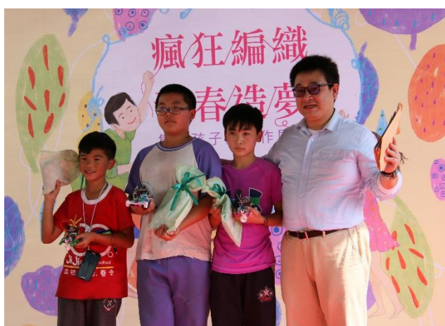
說明：獲獎學生與講師合影留念