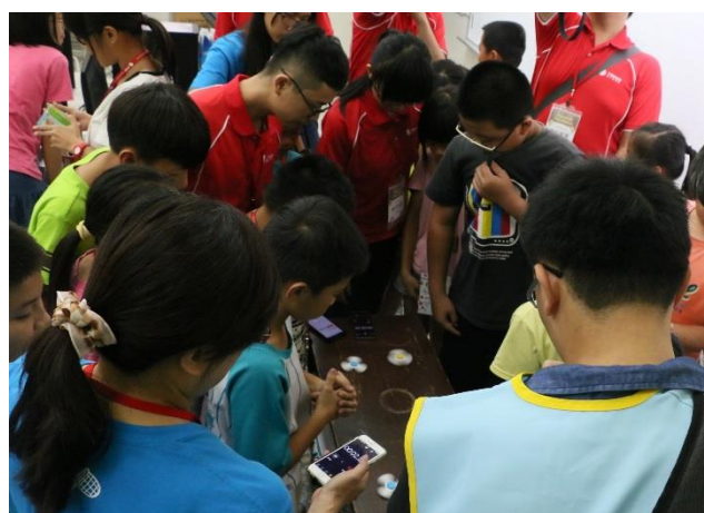
說明：用自己設計的指尖陀螺進行比賽