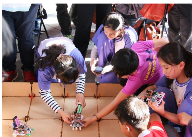
說明：至火車站前進行自製遙控車競賽