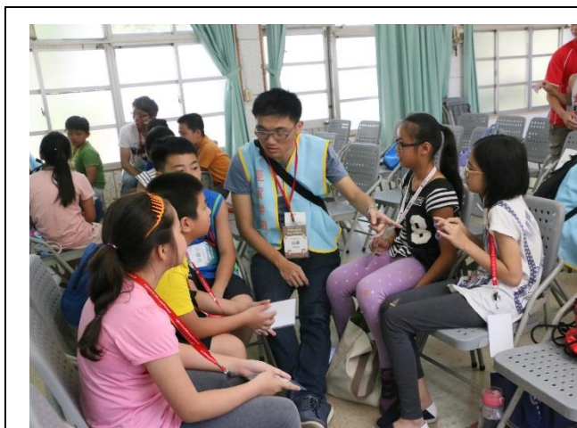
說明：學員與輔導員相見歡