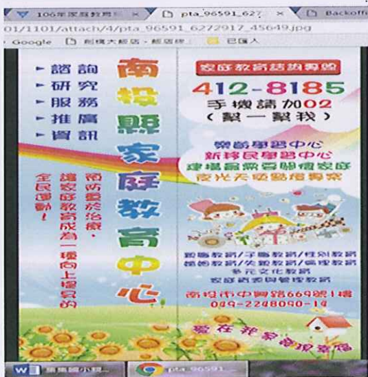
家扶中心摺頁宣導