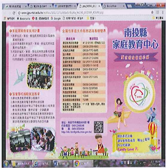
親職教育摺頁內容第一頁