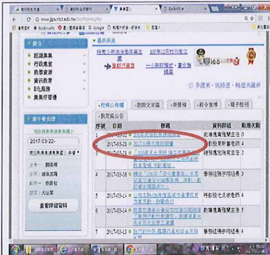
學校網頁公布欄公告宣導