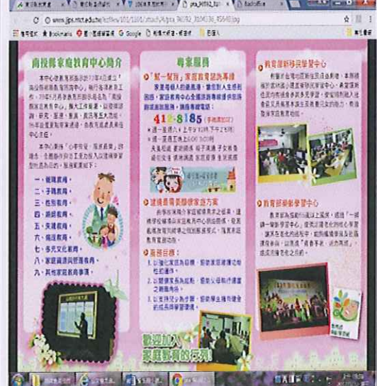
親職教育摺頁內容第二頁