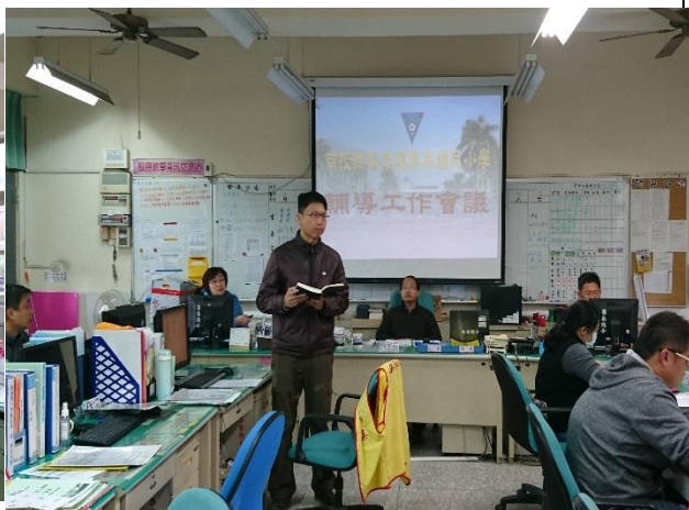
召開輔導工作會議