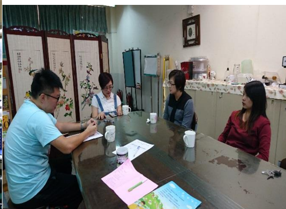
輔導諮商中心社工到校個案研討