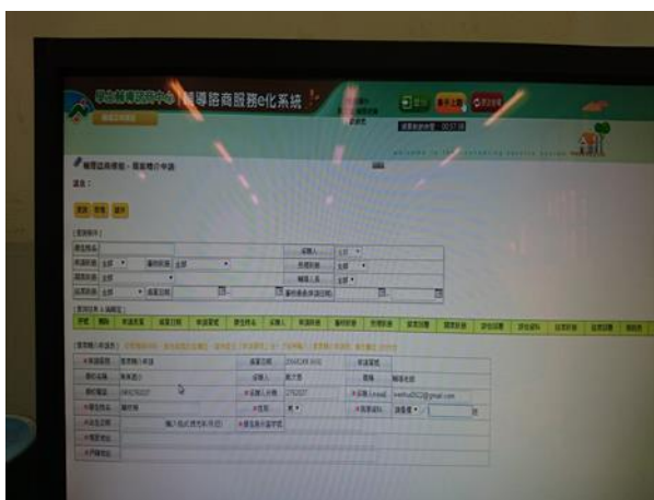
e化輔導系統申請專業輔導資源