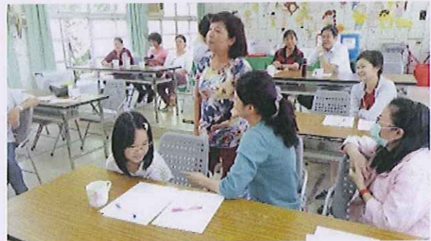
內容：親子衝突演示