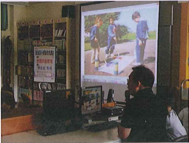
內容：孩子從遊戲中成長