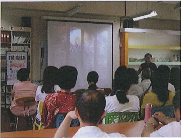
內容：講師感性的演說