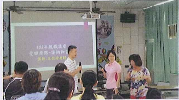
內容：親職角色扮演