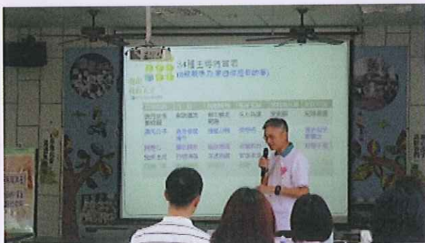
內容：認識孩子的創造力