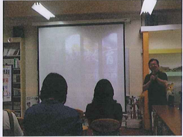
內容：德國美學分享