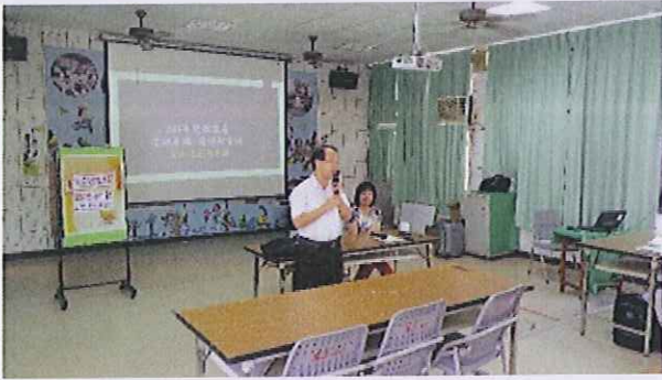
內容：親職講座-校長開場