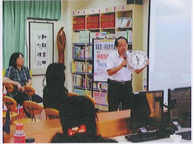
內容：校長分享本校學生作品