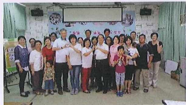
內容：親師生大合照