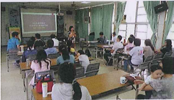
內容：講師感性的演說