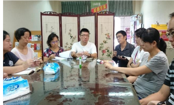
家訪注意事項說明