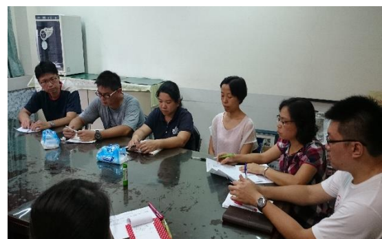
執行小組成員確認執行成果