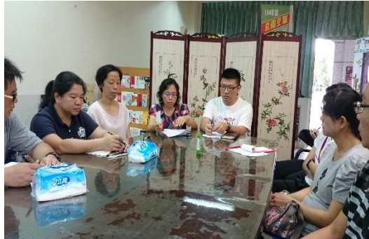
老師聆聽教優區執行計畫內容