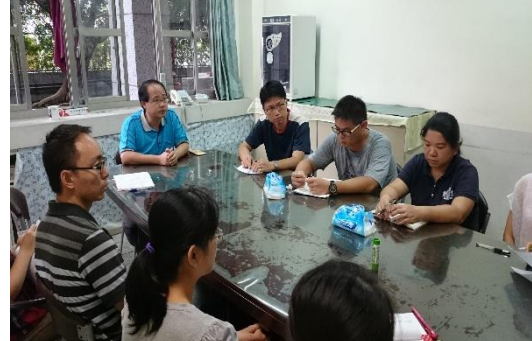
校長說明教優區執行目的