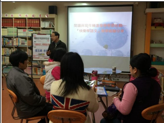
快樂學語文專業對話