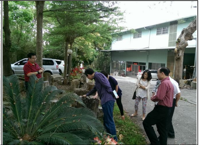
社寮國小—『行政交流』