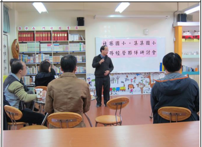
校務經營夥伴研討會