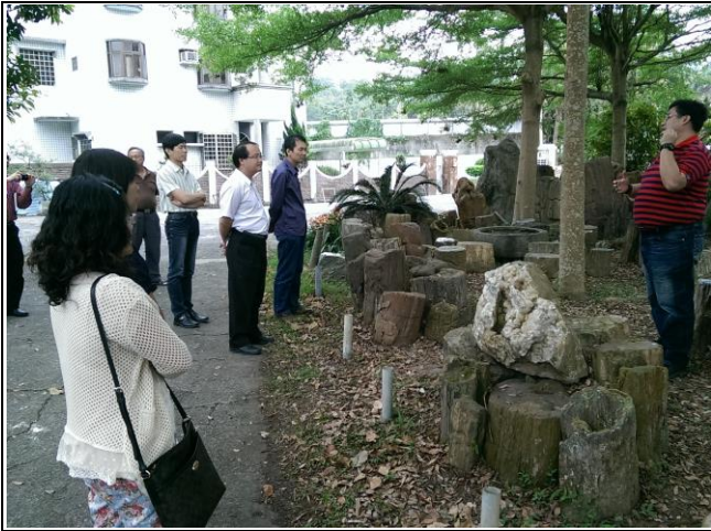
社寮國小—『行政交流』